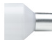
☞ Hřejivá bílá Ciepłobiały Тёплый Белый