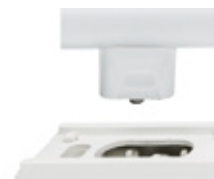
☞ Hřejivá bílá Ciepłobiały Тёплый Белый