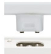
☞ Hřejivá bílá Ciepłobiały Тёплый Белый