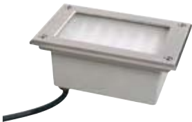
Profi Line Floor LED

Выдерживает любую нагрузку: благодаря типу защиты IP67 этот встраиваемый светильник из нержавеющей стали гарантированно водонепроницаемый, нержавеющей и пригоден для встраивания в наружной проходной зоне - вес до 1.700кг "Profi Line Floor" выдерживает без проблем. С встроенным рабочим агрегатом, для монтажа посредством обычной проводки 230 В