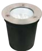
Profi Line Floor LED

Выдерживает любую нагрузку: благодаря типу защиты IP67 этот встраиваемый светильник из нержавеющей стали гарантированно водонепроницаемый, нержавеющей и пригоден для встраивания в наружной проходной зоне - вес до 2.000кг "Profi Line Floor" выдерживает без проблем.