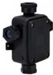
Sort-violet Czarny черный