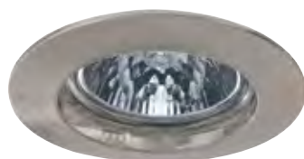
Kartáčované železo Żelazo szczotkowane Железо шероховатое

max. 1x50 W <A++-E> incl. 1x50 W , <B> <B-D> incl. 4x35 W , <C> <B-D> 675 lm, 2900 K 4x430 lm, 2900 K <math>\sphericalangle</math> 38°, 1800 cd <math>\sphericalangle</math> 38°, 1100 cd incl. <math>\square</math> 60 VA <math>\triangle</math> incl. <math>\square</math> 150 VA <math>\triangle</math> EAN 4000870 179437 EAN 4000870 989326 EAN 4000870 993538 179.43 989.32 993.53