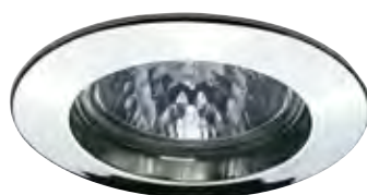
Chrom Chrom Хром

max. 1x50 W <A++-E> incl. 1x50 W , <B> <B-D> incl. 4x35 W , <C> <B-D> 675 lm, 2900 K 4x430 lm, 2900 K <math>\sphericalangle</math> 38°, 1800 cd <math>\sphericalangle</math> 38°, 1100 cd incl. <math>\square</math> 60 VA <math>\triangle</math> incl. <math>\square</math> 150 VA <math>\triangle</math> EAN 4000870 179451 EAN 4000870 989333 EAN 4000870 993606 179.45 989.33 993.60