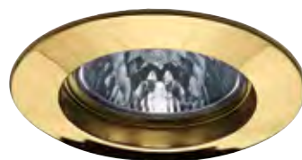
Zlatá Złoty Золото

max. 1x50 W <A++-E> incl. 4x35 W , <C> <B-D> 4x430 lm, 2900 K <math>\sphericalangle</math> 38°, 1100 cd incl. <math>\square</math> 150 VA <math>\triangle</math> EAN 4000870 179468 EAN 4000870 993569 179.46 993.56