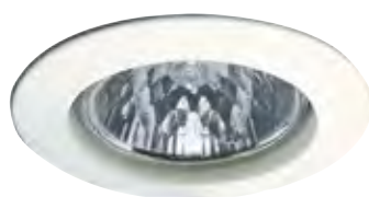
Bílá Biały Белый

max. 1x50 W <A++-E> incl. 1x50 W , <B> <B-D> incl. 4x35 W , <C> <B-D> 675 lm, 2900 K 4x430 lm, 2900 K <math>\sphericalangle</math> 38°, 1800 cd <math>\sphericalangle</math> 38°, 1100 cd incl. <math>\square</math> 60 VA <math>\triangle</math> incl. <math>\square</math> 150 VA <math>\triangle</math> EAN 4000870 179437 EAN 4000870 989326 EAN 4000870 993538 179.43 989.32 993.53